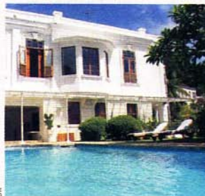
Une ancienne demeure coloniale transformée en maison d'hôte.

Forfait 7 jours/4 nuits à Casa Mama Ruisa : vols A/R sur TAM voyages, transferts, 4 nuits, petits déjeuners inclus, à partir de 1 300 €/pers. www.vdm.com